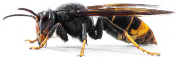
■ FRELON ASIATIQUE ■ Vespa Velutina Nigrithorax

Le frelon asiatique vit en colonie dans des nids constitués de bois en décomposition, de papier et de salive. Il est formé d'une enveloppe externe qui protège les frelons des stress biotiques et abiotiques et renferme des galettes horizontales disposées parallèlement. C'est sur la face inférieure de ces galettes que se situe les alvéoles, dans lesquelles les larves se développent.