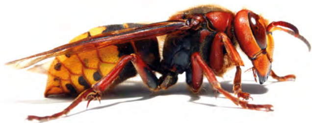
■ FRELON EUROPÉEN ■ Vespa Crabro

Mesurant en moyenne entre 17 et 30mm, le frelon asiatique est légèrement plus petit que son confrère européen. Il se démarque du frelon européen par sa face orange, ses pattes jaunes et son abdomen à dominance noire avec des bandes orangées. Capacité du nid : 15000 individus contre 5000 pour le frelon européen.